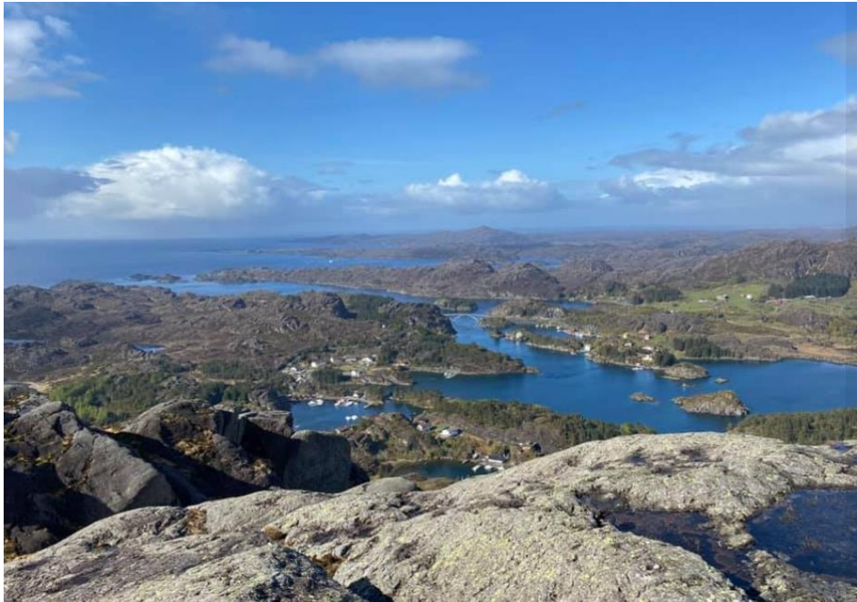
Fjelltrimposten Rammenipa vart brukt 17. mai 2020