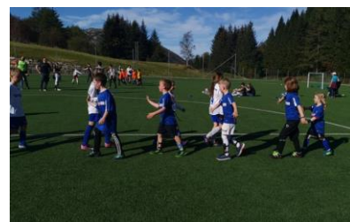
Fotballturnering på Dalsøyra