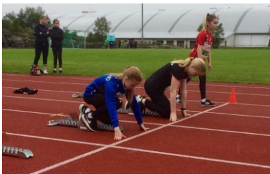
AKS-leikane i Knarvik