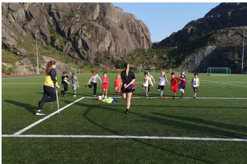
Frå fotballturneringa til 1.-3.klasse hausten 2019.