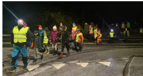
Nissemarsjen desember 2019