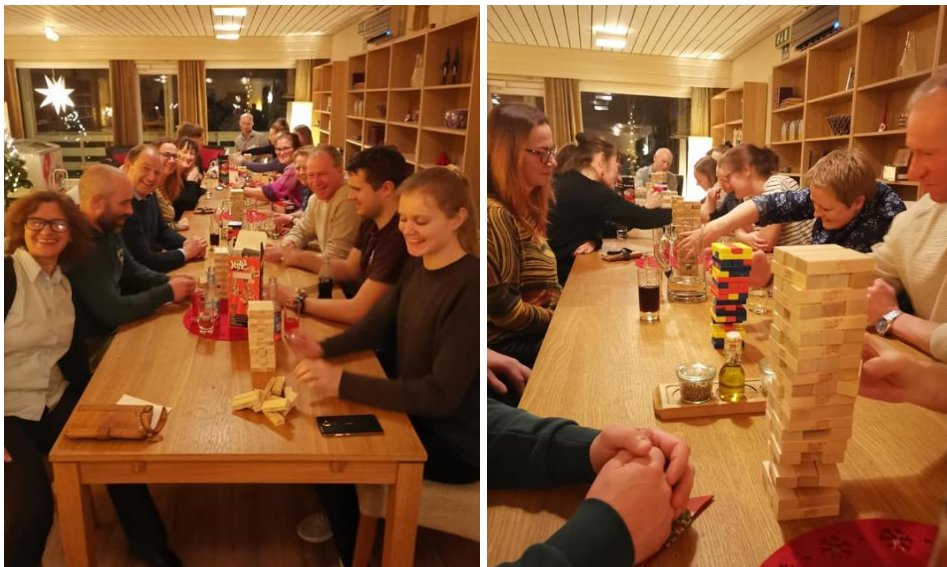
Dei viktigaste i Solund Idrettslag: DEI FRIVILLIGE samla på Skafferiet til sosial samling med pizza og Jengaturnering 21. desember. FOR ein flitt gjeng!!