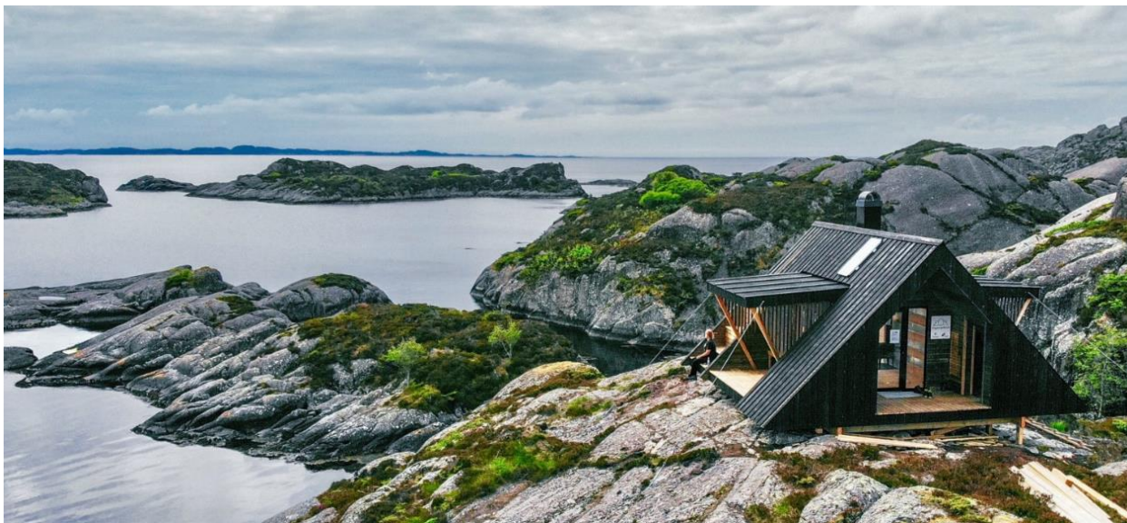
Ny fjelltrimpost: Sognesjøhytta