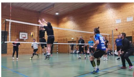
Sula Hula cup jula 2019