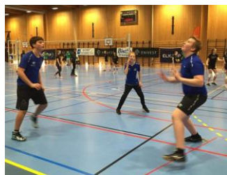
Enivestcup i Florø